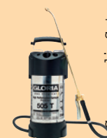
GLORIA 505 T GLORIA 510 TK GLORIA PRO8 GLORIA PRO5