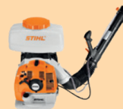
Atomizzatore a spalla STIHL SR 450